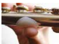
My GRIP anti glisse 12€