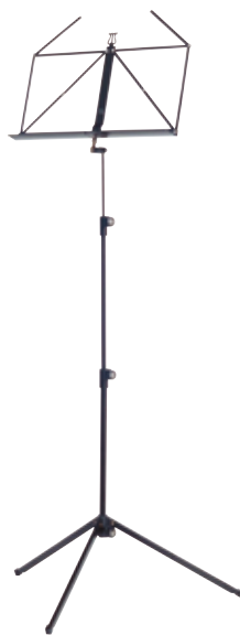
Pupitre à partir de 28€