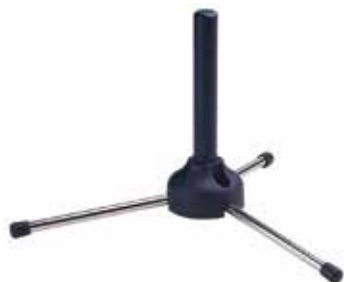
Support KM 18€