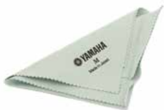
Chiffon pour argent 12€