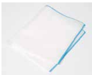
Gaze de nettoyage 6€